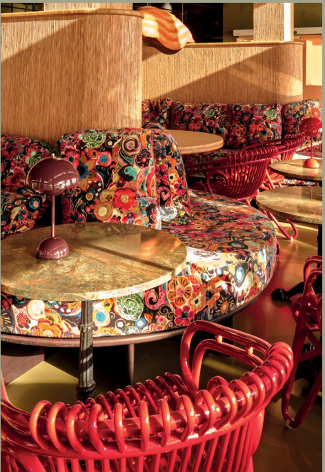
Bunte Muster treffen auf satte Farben, verschiedene Stile werden miteinander kombiniert. Und trotzdem passt am Ende alles zusammen.