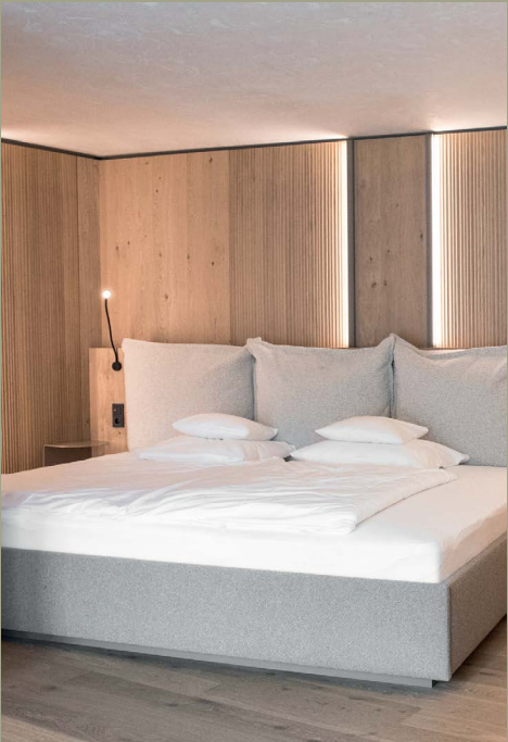
Das extragroße Familienbett vor der wandhohen Holzvertäfelung sorgt für besondere Gemütlichkeit.