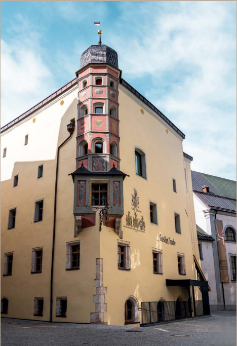
Einzigartige Ecken wurden im Design mitgedacht. Im Hotel Traube gleicht kein Winkel dem anderen.