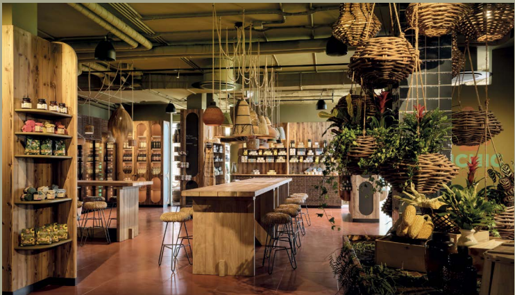
Für insgesamt 119 Zimmer und den öffentlichen Bereich durften wir die Möbel liefern und montieren.

Manche Hotels bleiben allein durch ihre Lage im Gedächtnis. Andere schaffen durch ihr Interior Design ein zusätzliches Erlebnis. Das Bikini Island & Mountain Hotel Es Trenc auf Mallorca ist beides: bunt, unkonventionell und voller überraschender Details.